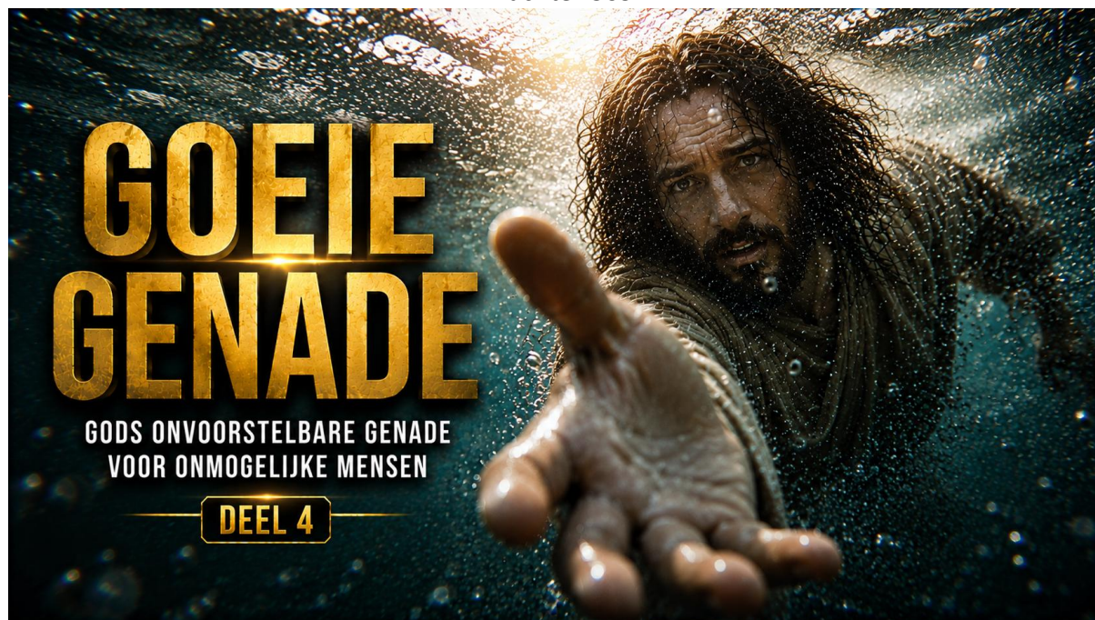
Goeie Genade - deel 4