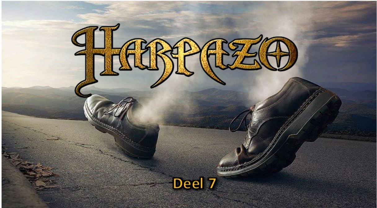
Harpazo – Deel 7