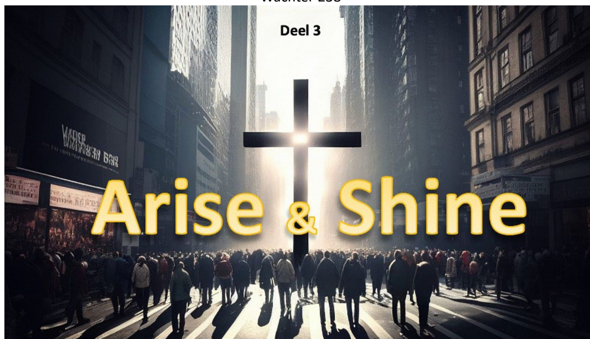
Arise & Shine -deel 3