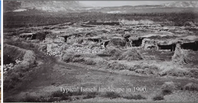
Typical Israeli landscape in 1900.

Dit land was volledig troosteloos en verlaten tot het begin van de 20 e eeuw. Gedurende al deze eeuwen was er nooit een onafhankelijke staat met Jeruzalem als hoofdstad. Er heeft nooit een Palestijnse staat bestaan met een Palestijnse hoofdstad. En al evenmin was er een Palestijnse taal of cultuur. (Er is nooit een archeologische vondst gedaan die dit bevestigt).