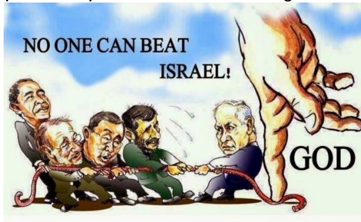
De vinger van God