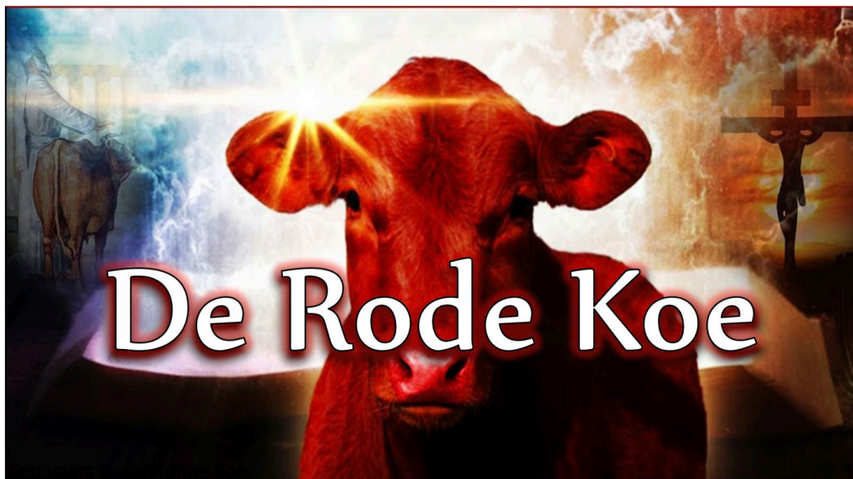
De Rode Koe