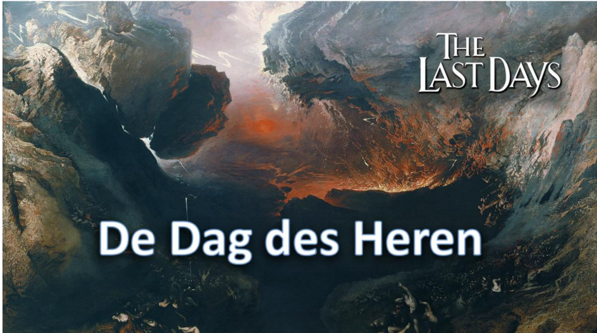
De Dag des Heren