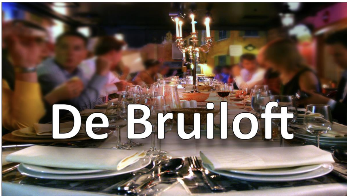
De Bruiloft van het Lam