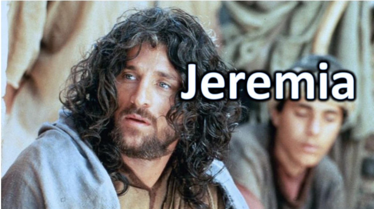
De profeet Jeremia